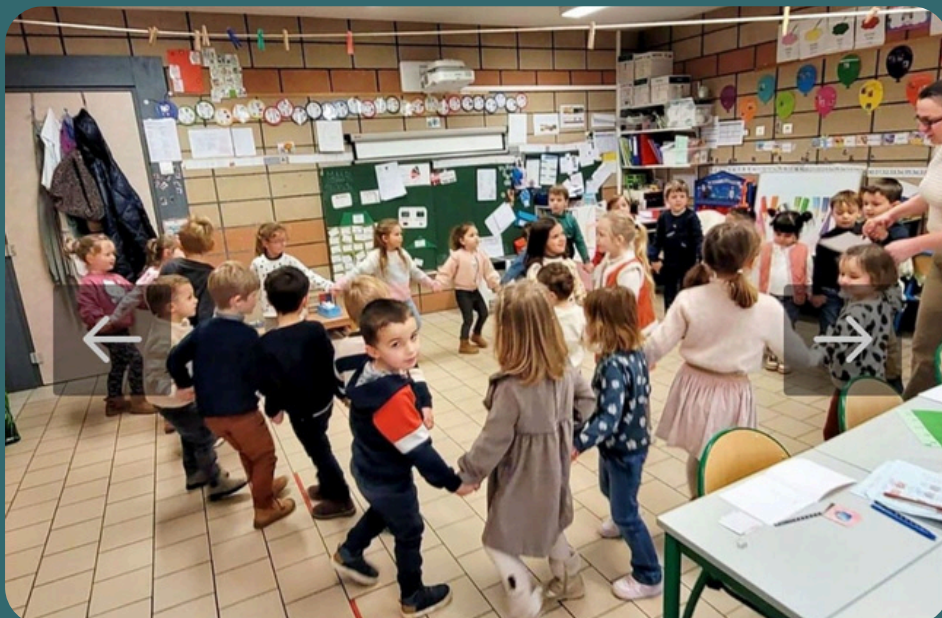
Théâtre : La ronde de la moufle