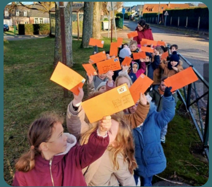
Les maternelles postent leur carte de vœux.