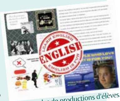
Exemples de productions d'élèves.